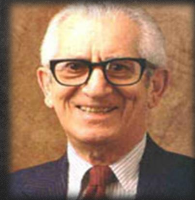
Dr. Benjamin Bloom 1956