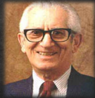
Dr. Benjamin Bloom 1956