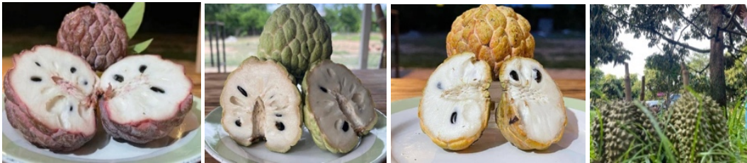
ภาพที่ 5: ภูมิปัญญาท้องถิ่นเชิงเกษตรกรรมและการเป็นแหล่งท่องเที่ยวที่สร้างรายได้ให้แก่ชุมชนปากน้ำปอย (น้อยหน้าพันธุ์ครึ่ง-พันธุ์เขียวนวล-พันธุ์ทองนวลจันทร์-ทุเรียนปากน้ำปอย)

2. โปรแกรมท่องเที่ยวแบบ 2 วัน 1 คืน มีกิจกรรมที่น่าสนใจที่หลากหลายให้นักท่องเที่ยวได้เลือกตามความต้องการ ได้แก่ กิจกรรมการท่องเที่ยวในโปรแกรมท่องเที่ยวแบบที่ 1 แต่เพิ่มเติมในเรื่องที่พักแบบแรมบ้ปั้งบริเวณริมน้ำตกปอย จำนวน 1 คืน พร้อมทำกิจกรรมรอบกองไฟ หรือกิจกรรมนันทนาการอื่น ๆ ได้