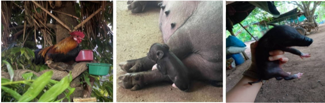
ภาพที่ 7: ภูมิปัญญาท้องถิ่นเชิงเกษตรกรรมและแหล่งท่องเที่ยวเพื่อการเรียนรู้ (การเลี้ยงไก่ตระกร้า-ขยายพันธุ์หมูป่าที่สร้างรายได้เศรษฐกิจหมุนเวียน (BCG model)