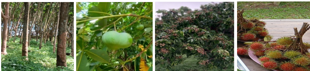
ภาพที่ 6: ภูมิปัญญาท้องถิ่นเชิงเกษตรกรรมและสวนเกษตรแหล่งท่องเที่ยวเพื่อการเรียนรู้ (การปลูกเงาะ-ลำไย-สวนยางพาราของชุมชนปากน้ำปอย)