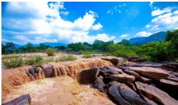
ภาพที่ 2: ภูมิทัศน์วัฒนธรรม-ธรรมชาติ (Natural and Cultural Landscape) ที่น้ำตกปอยไหลผ่านกลางหมู่บ้าน ที่มา : https://thai.tourismthailand.org (2566)

อำเภอด่านซ้ายจังหวัดเลย ประวัติชุมชนเล่าว่าเดือนสามจะมีนางแอ่นมาเกาะตามบ้านเรือน ชาวบ้านเรียกติดปากว่า “บ้านวังนกแอ่น” สภาพพื้นที่มีลักษณะภูมิประเทศเป็นที่ราบสูงและภูเขา พื้นที่ส่วนใหญ่อยู่ในเขตป่าสงวนแห่งชาติลุ่มน้ำวังทองฝั่งซ้ายและฝั่งขวา มีแม่น้ำเซ็กไหลผ่านกลางตำบลจากทิศตะวันออกไหลไปสู่อ่าวตง