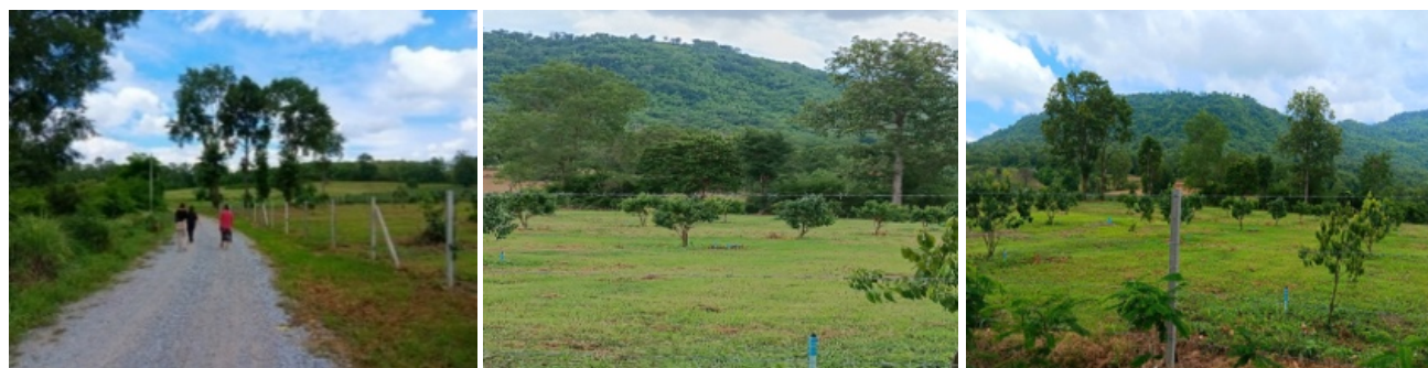
ภาพที่ 3: ภูมิทัศน์วัฒนธรรม-พื้นที่ตั้งแคมป์ (Camping Sites) ของชุมชนปากน้ำปอย

ด้านภูมิทัศน์วัฒนธรรมของชุมชน ได้แก่ 1) ความงามของน้ำตกปอยซึ่งเป็นหนึ่งในน้ำตกที่มีชื่อเสียงมากแห่งหนึ่งของจังหวัดพิษณุโลก ตั้งอยู่บนทางหลวงหมายเลข 12 และเส้นทางหลวงแยกเข้าสู่ น้ำตกปอยประมาณ 3 กิโลเมตร ถนนทางเข้ามีความสะดวกสบาย ลาดยาง สวยงามและร่มรื่น 2) ภูมิทัศน์วัฒนธรรมด้านที่ตั้งของชุมชน เนื่องจากเป็นพื้นที่ป่าอนุรักษ์และอยู่ในการดูแลขององค์การอุตสาหกรรมป่าไม้สวนป่าเขากระยาง นับว่าเป็นจุดแข็งในด้านการส่งเสริมการท่องเที่ยวทางธรรมชาติและวัฒนธรรมพื้นถิ่น พื้นที่ที่มีความร่มรื่นเหมาะแก่การพักผ่อนและเหมาะสมกับการเป็น “พื้นที่ตั้งแคมป์” (Camping Sites) ใกล้ชิดธรรมชาติ ทำให้เป็นที่สนใจจากนักท่องเที่ยว